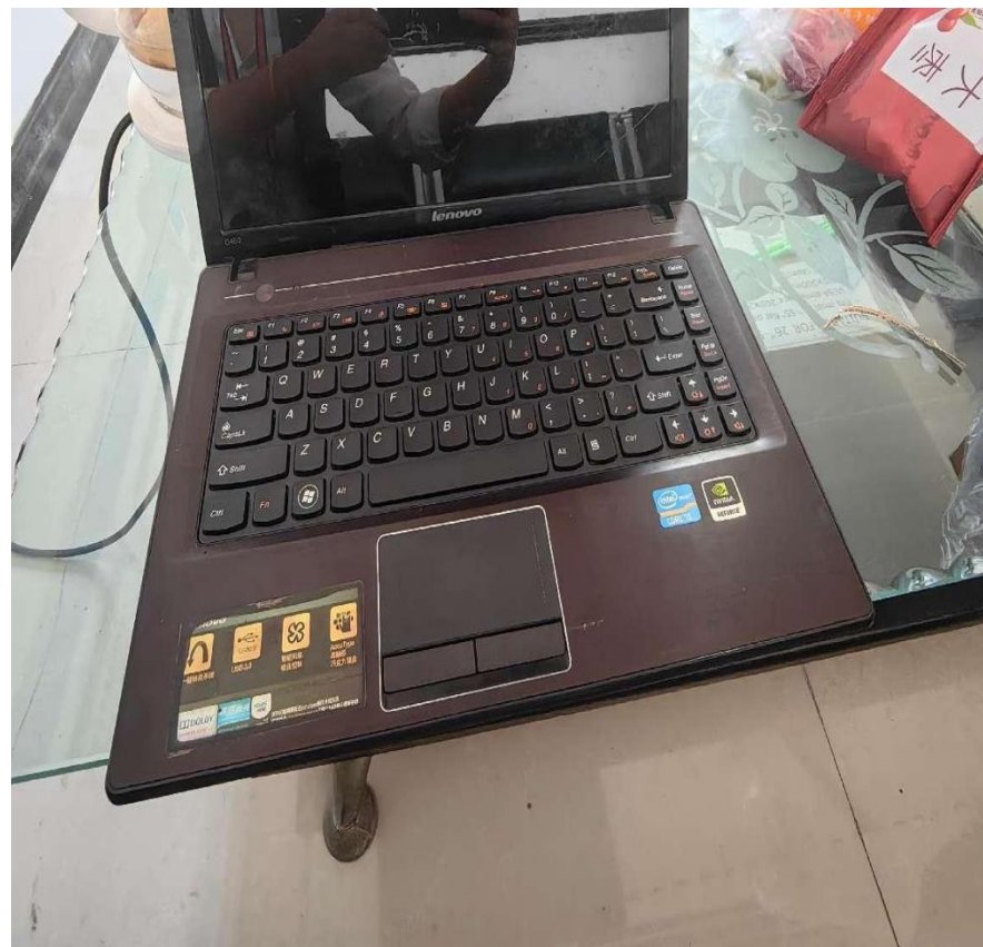
Lenovo G480 笔记本电脑