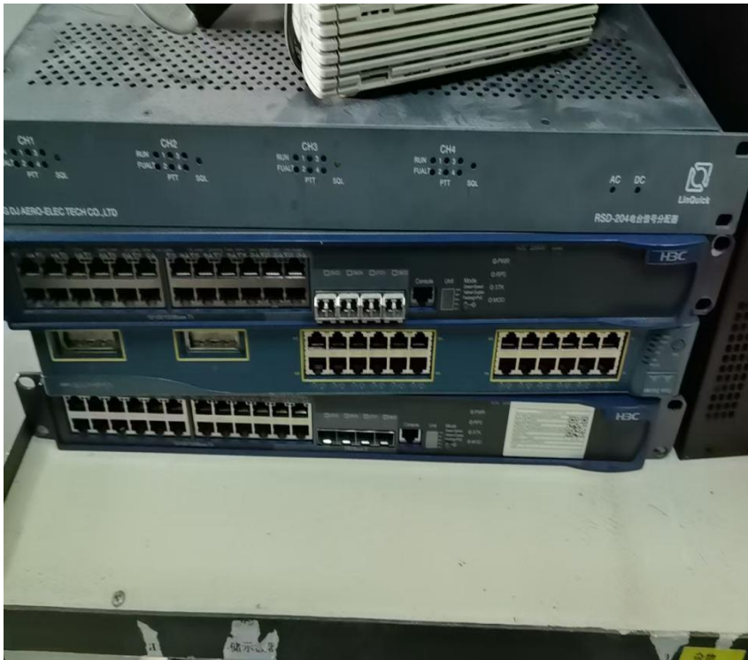
网络系统改扩建工程（交换机）